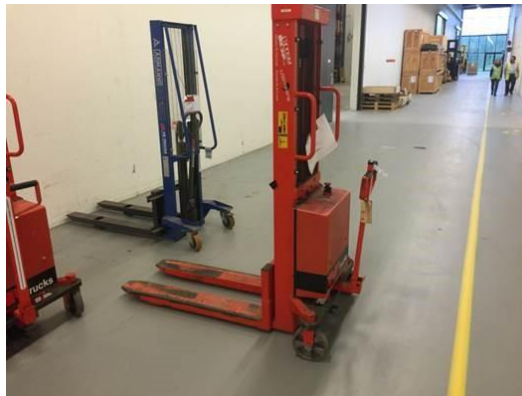
Stabler 2 – kræver ikke certifikat