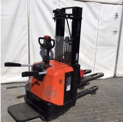
Stabler 1 – kræver certifikat